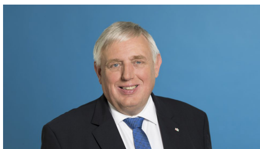
Herr Karl-Josef Laumann, Minister für Arbeit, Gesundheit und Soziales des Landes NRW übernimmt die Schirmherrschaft des Jubiläumskongresses.